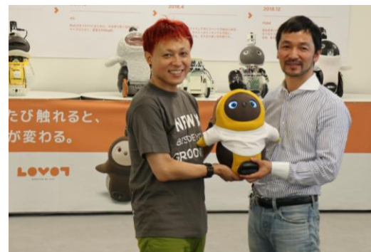
※写真の『LOVOT』用トップスにオリジナルデザインがプリントされます。限定トップスのオリジナルデザインにご期待ください

2019年8月28日（水）までにご予約いただき、2019年9月30日（月）までに購入手続きを完了された方限定の特典となっております。